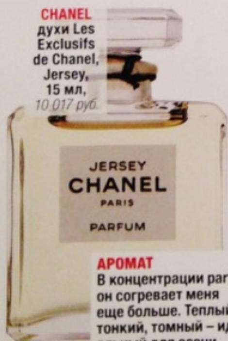
CHANEL духи Les Exclusifs de Chanel, Jersey, 15 мл, 10 017 руб.

АРОМАТ В концентрации parfum он согревает меня еще больше. Теплый, тонкий, томный – идеальный для осени.