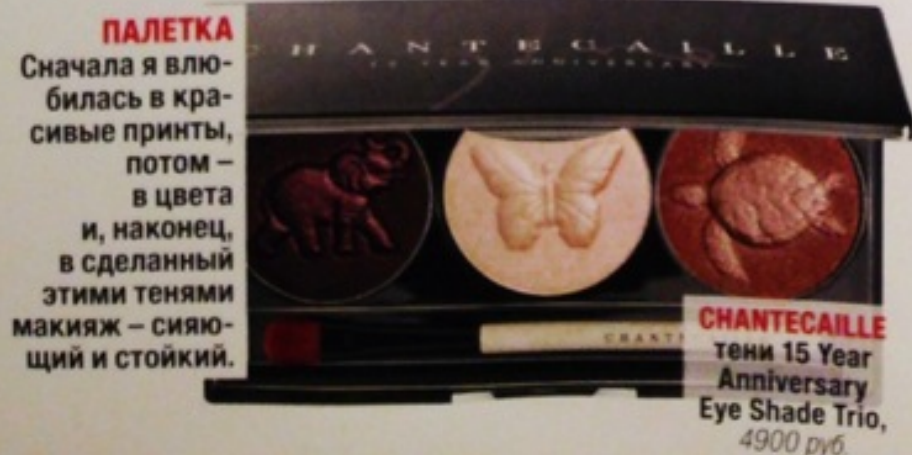
ПАЛЕТКА Сначала я влюбилась в красивые принты, потом – в цвета и, наконец, в сделанный этими тенями макияж – сияющий и стойкий.

ОРГАНИЧЕСКИЙ СОК Во-первых, он вкусный. Во-вторых, полезный. А в-третьих, вполне может заменить легкий перекус. Но не обед!