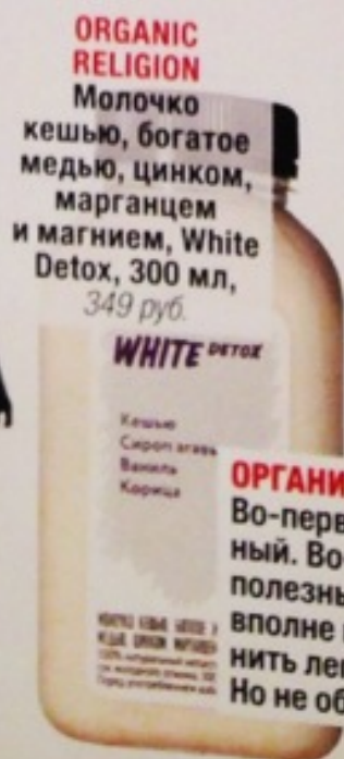
ORGANIC RELIGION Молочко кешью, богатое медью, цинком, марганцем и магнием, White Detox, 300 мл, 349 руб.

Эти страницы из американского Allure были созданы гениальным художником и арт-директором журнала Александром Либерманом больше двадцати лет назад. Но в них до сих пор чувствуется его энергия и страстная любовь к красоте.